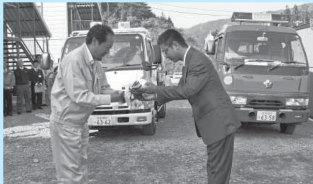
鍵のオブジェを手渡す市道副市長 (写真右) と戸羽市長

車両 2 台の寄贈を受けて、戸羽市長は「羽曳野市の皆さんのお気持ちがこもった車両の贈呈をととてもありがたく感じております。今後大切に使用させていただきます」と感謝の意を述べました。