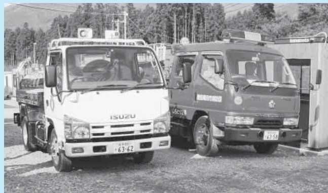
寄贈された給水車 (左) と消防ポンプ車