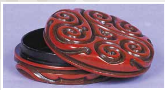
「金聯の香合」

写真は「金聯の香合」と言われる五種の宝躰の一つで、香などを入れる容器として使われた物です。