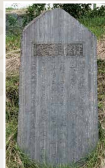
広田小学校の津波記念碑

この記念碑は、明治29年6月と昭和8年3月に発生した津波の教訓として、昭和9年3月に建てられました。場所は、明治29年の津波到達地点と言われ、この他に広田町内には7基の記念碑が建てられています。