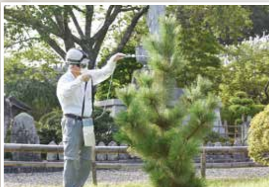
「華蔵寺の宝珠マツ」薬剤散布の様子

「伝統芸能の楽器を新調したい」「樹木の生育状況を樹木医に診てほしい」「活用のため説明看板を設置したい」など、お困りのことがあれば、ぜひご相談ください。