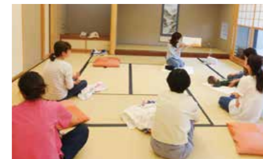
前期の乳幼児学級の様子

子育ての悩みや不安を解決するヒントを見つけたり、受講生同士の情報共有や、友達づくりの場として学習会に参加してみませんか。