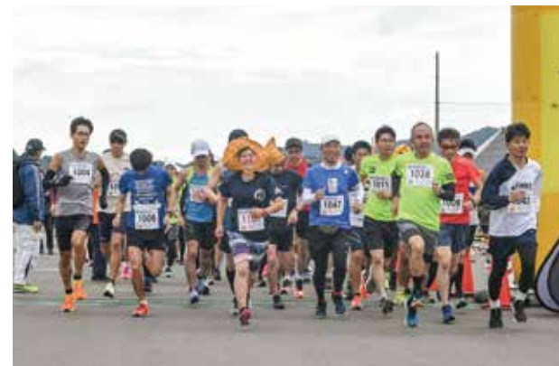
各種スポーツイベントで市民の健康づくりを推進します