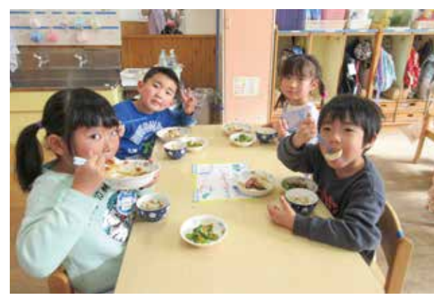
3歳児以上の保育所・保育園の副食費を無償化します