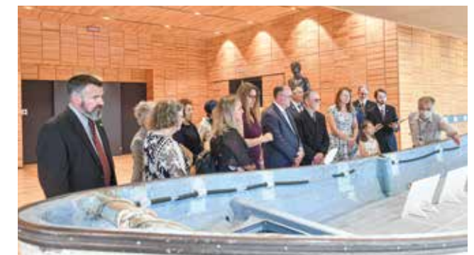
姉妹都市であるクレセントシティ市との交流を推進します