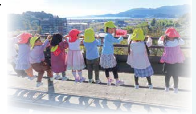
子ども達が健やかに成長できるよう子育て支援を行います

また、「陸前高田市まちづくり総合計画」の後期基本計画の初年度となることから、これまでの事業実施の成果、住民ニーズなどの検証を行い、「次世代につなげる持続可能なまちづくり」を推進します。