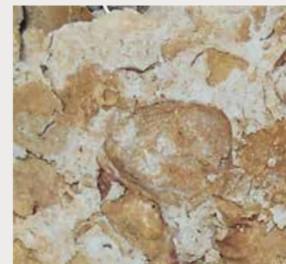
腕足類を含む化石密集砂岩