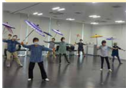
いこまたかた、あばっせなごや 傘踊り講座