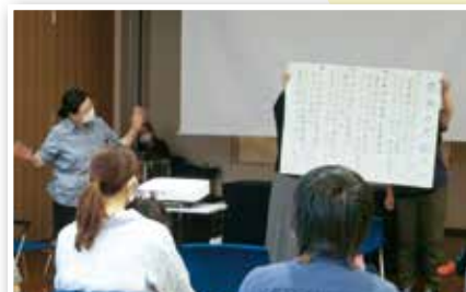
みんなで一緒に歌や手遊びも