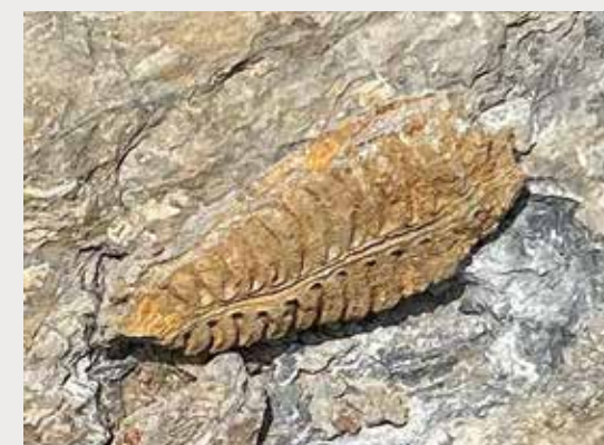
腕足類(レプトダス・ノビリス)