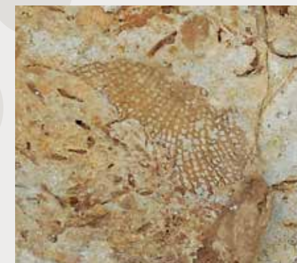
外肛動物(コケムシ)

このため、貴重な「地域のたから」を大切に守り、有効に活用するため、当該地域を4月1日付けで陸前高田市指定天然記念物(地質鉱物)に指定しました。