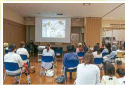
どんなおはなしかは当日のお楽しみ！