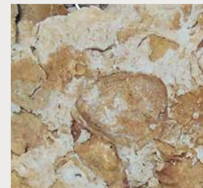
腕足類を含む化石密集砂岩