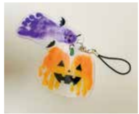
足形アートのイメージ