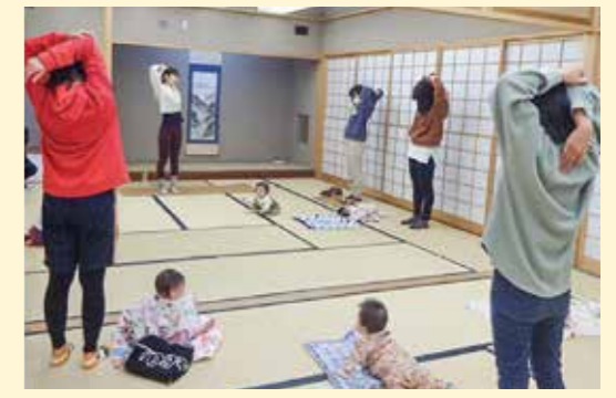
昨年度の乳幼児学級の様子