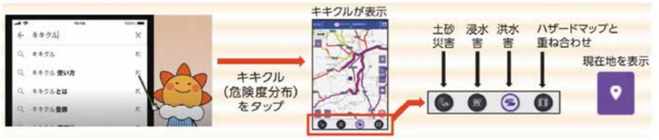
参考「佐賀地方気象台、「使おう！キキクル」リーフレット」

スマホ・パソコンで「キキクル」と検索し、気象庁のページ内で利用することができます。