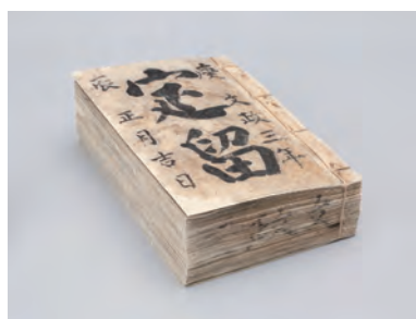
吉田家文書 県指定有形文化財(陸前高田市)