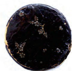
金銀時絵鏡箱 国指定重要文化財(平泉町)