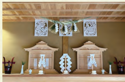
正月飾りを施した旧吉田家住宅主屋の神棚(左)と床の間(右)