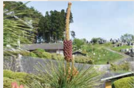
昨年の春に咲いた雌花

順調にいけば、本年の秋頃には、これまでにない見事な宝珠マツの姿をお披露目できそうです。