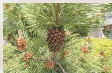
現在の球果(5月15日撮影)