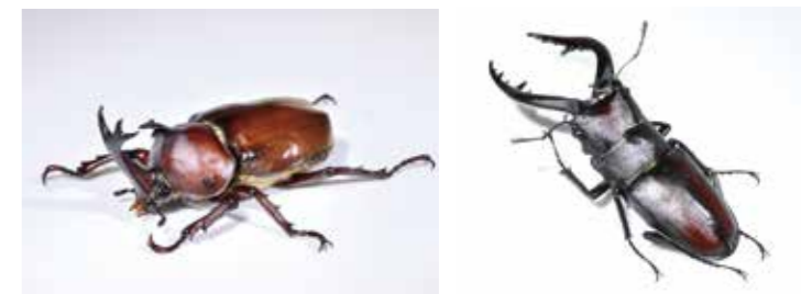
虫のからだをよく観察してみよう！