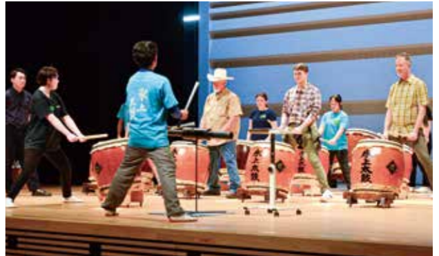
昨年の市民交流の様子