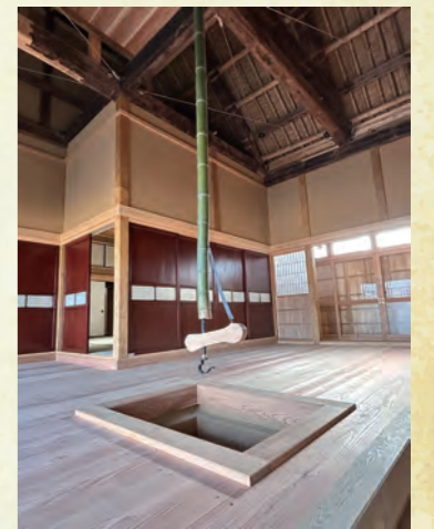
集会所として使用された「だいどころ」

開館は5月23日(金)です。ひとたび門をくぐれば江戸時代にタイムスリップしたかのような体験ができるよう、様々な工夫を凝らして皆さんをお待ちしています。