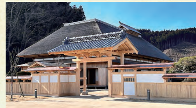
「薬医門」様式の正門