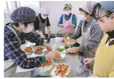
いきいき元気健康教室