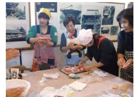
過去の椿ゆべし作りの様子