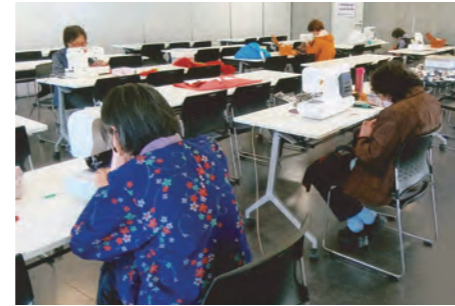
きものリメイク教室