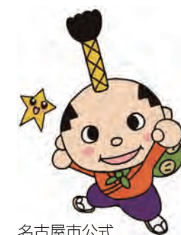
名古屋市公式 マスコットキャラクター はち丸とかなえっち

名古屋市陸前高田市絆実行委員会 メール：activistshiho@gmail.com