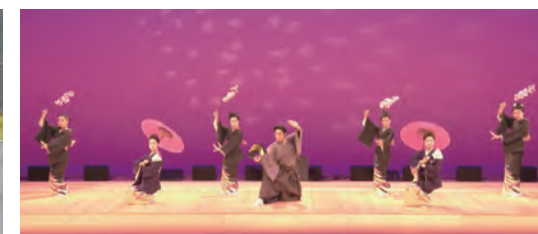
②東扇派 藤間流 瑞穂流 見咲樹会