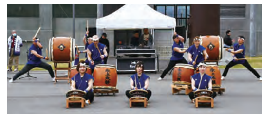
①氷上共鳴会 氷上太鼓