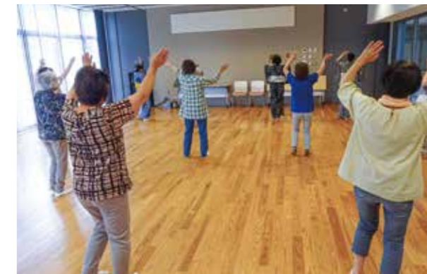
過去の講座の様子

市では、文化・芸術に親しむことを目的として「みんなで踊ろう!チャオチャオ♪陸前高田」講座を開催します。今回は「チャオチャオ陸前高田」「陸前高田音頭」「寄さこい見さこい陸前高田」「いこまいたかた、あばっせなごや」の4曲を学びます。本市にとって馴染み深いチャオチャオを楽しく踊ってみませんか。お気軽にご参加ください♪