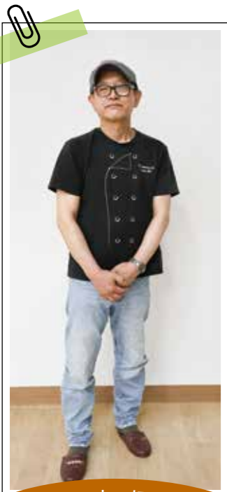
みんなでいっしょに子ども食堂 実行委員会