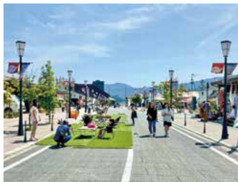
過去の歩行者天国の様子