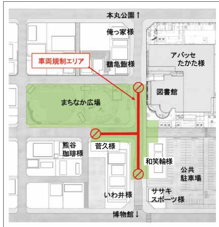
歩行者天国エリア図