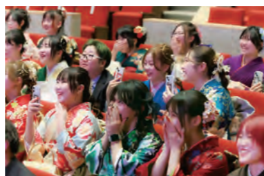
令和7年二十歳のつどいの様子