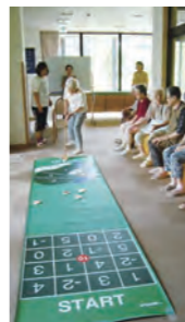
シャッフル ゴルフの様子

パターでボールを打ち得点を競います。ボールは、32面体でできており、意外な方向へ転がり、楽しさが倍増です。また、スタート位置を変えて、2種類のゲームを楽しめます。