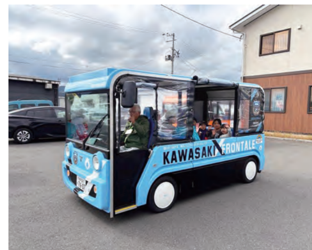
川崎フロンターレ仕様のモビタ

本年は、3台目の車両として、サッカーJ1・川崎フロンターレのチームカラーやエンブレムを随所に用いた「川崎フロンターレ仕様」のモビタを新たに導入しました。