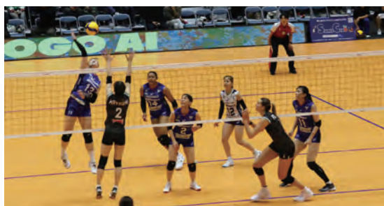
豪快なスパイクで会場を盛り上げました

バレーボール・SVリーグ女子の埼玉上尾メディックスのホームゲームが、11月22日（土）、23日（日）の2日間にわたり、夢アリーナたかたで行われました。