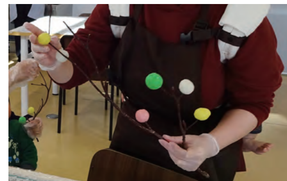
過去の講座の様子