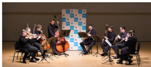
世界トップレベルの素晴らしい演奏を披露してくれました

ワークショップに参加した高田高校吹奏楽部の生徒は「ワークショップでの演奏では緊張したが、息の出し方などのとても参考になるお話を聞いた。コンサートも迫力のある素晴らしい演奏だった」と振り返っていました。