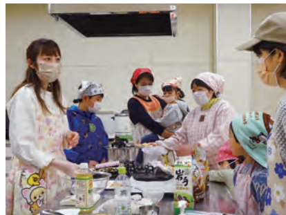
菅野香澄氏による家庭教育講座の様子