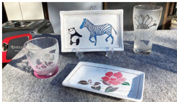
第2、3回目で制作する作品のイメージ ※写真のようなコップや皿などをご用意いただきます。