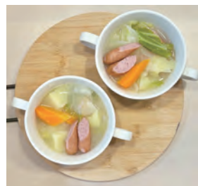
当日調理予定のポトフ (イメージ)