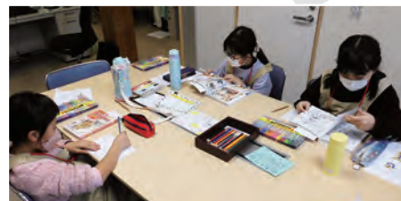
体験の中では、おススメ本の紹介も

日 時：令和8年1月10日(土) 午前9時30分～午後3時 場 所：市立図書館 定 員：3名(先着順、市内在住の小学4～6年生対象) 講 師：市立図書館 司書 参 加 費：無料 申込方法：図書館またはホームページにある申込書で申し込み 申込期限：12月27日(土)