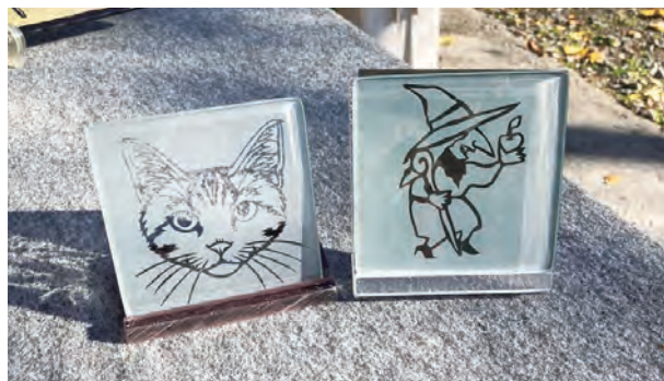
初回で制作するガラス板のイメージ ※当日は15cm×15cmのガラス板を用意します。