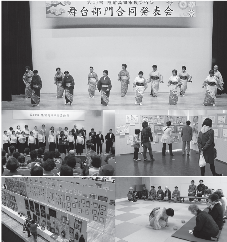
昨年の市民芸術祭の様子

◆問い合わせ先：市芸術文化協会 ☎ 0192(55)5540 または市教育委員会生涯学習課生涯学習係(内線255)