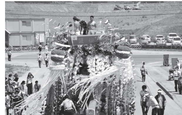
コミュニティ助成事業で整備した「気仙町けんか七夕祭り」の山車