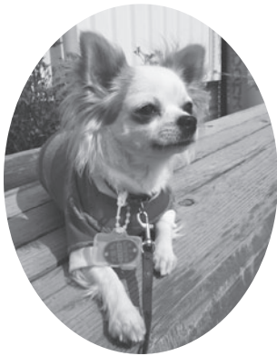
鑑札を装着している犬

迷子になり飼い主のもとに戻ることができない動物は少なくありません。犬には首輪などに鑑札を付けなければなりません。その他の動物でも名札などを付けるようにしましょう。