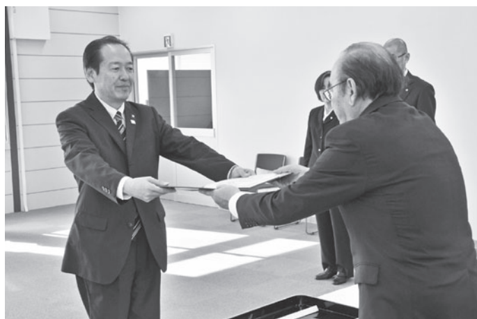
当選証書を受け取る戸羽氏