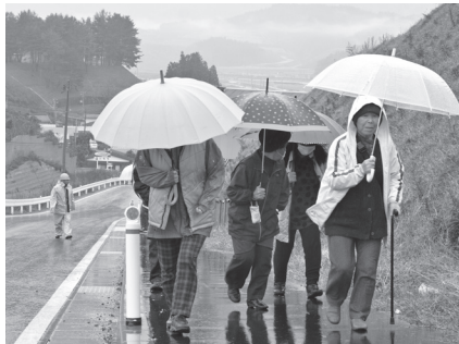
昨年の津波避難訓練の様子