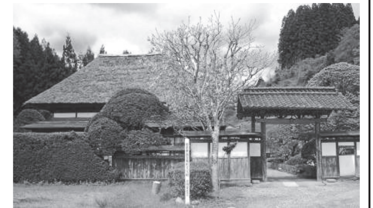
震災前の吉田家住宅