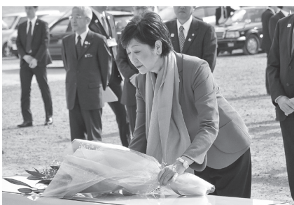
県内のフラッグツアーの一環で、2月17日には小池百合子東京都知事が陸前高田市を訪問