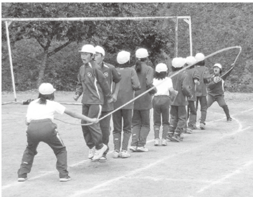
竹駒小学校でのロープジャンプX

イベントのファイナルを飾る第一中学校での閉会式では、ストレッチや玄米ニギギ体操、高田音頭などが行われ、フィナーレに向けて大きく