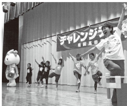
閉会式イベントでのゆめちゃん音頭