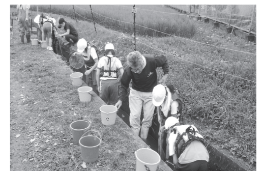
水路で生物を探す子供たち

ムシなど最近ではあまり見ることが出来なくなった生物など、20種類を超える生物の採集・観察や、水路の水質調査を行いました。