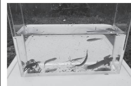
水路で見つけた生物

あいにくの曇天の中での開催となりましたが、子どもたちは、モクズガニやウグイ、ドジョウ、そしてコオイムシやナベバタ