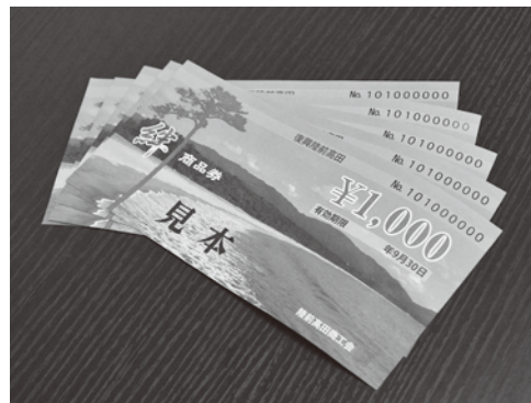
陸前高田地域共通商品券