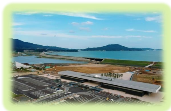
高田松原津波 復興記念公園