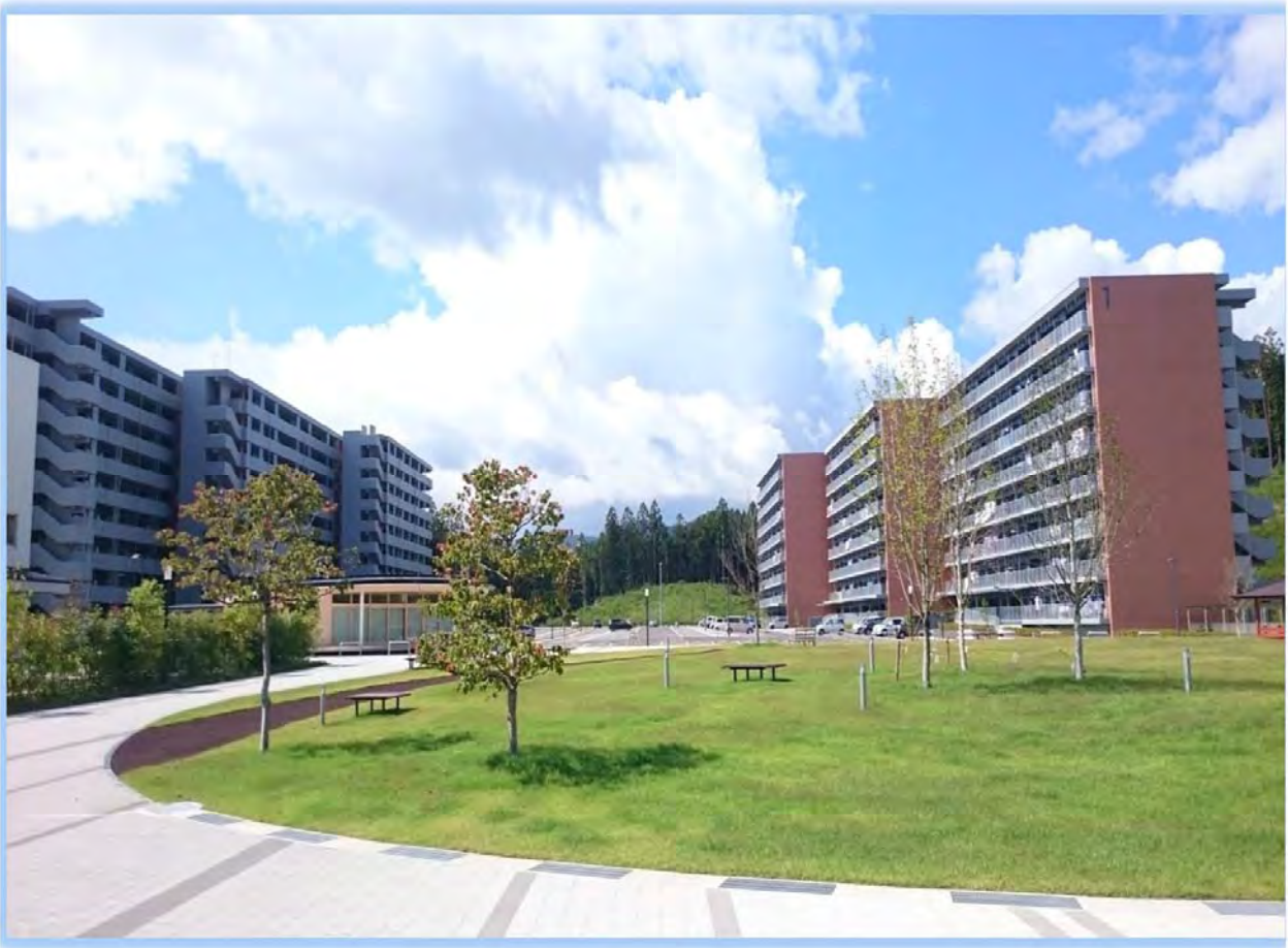
市内最大の災害公営住宅