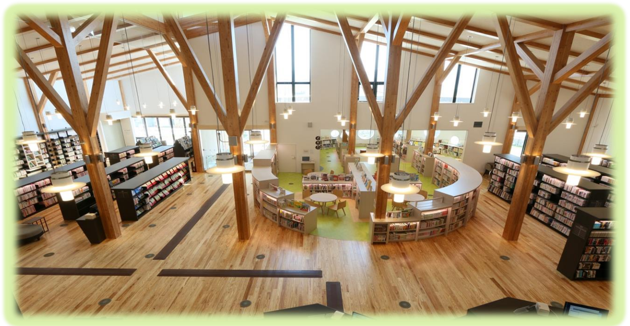
平成29年7月にオープンした市立図書館