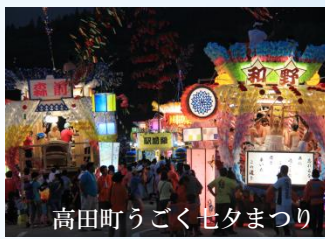
高田町うごく七夕まつり

東日本大震災による津波に耐えて、一本だけ残った松は、復興のシンボルとして人々の心の支えとなっております。