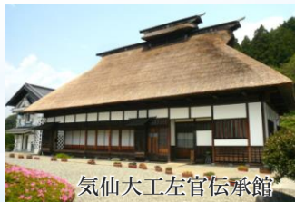
気仙大工左官伝承館

陸前高田市にそびえる氷上山の山頂からは、広田湾はもちろん三陸海岸を見下ろし、金華山まで展望できます。