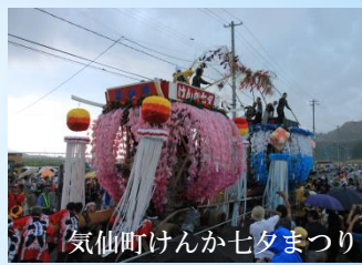
気仙町けんか七夕まつり

華やかな装飾を施した「うごく七夕」が大きな掛け声とともに、町中を練り歩く煌びやかなお祭りです。