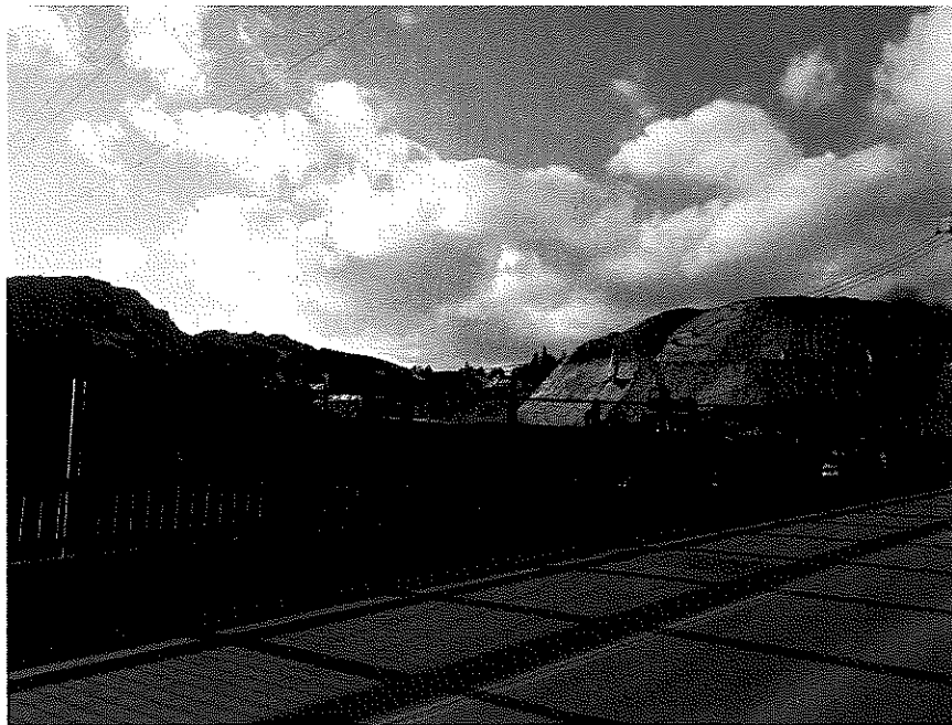
(整備が進む高田西地区)