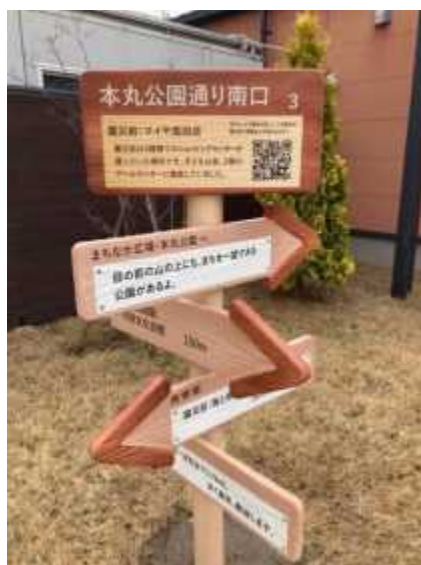
②まちなか会・歴史サイン