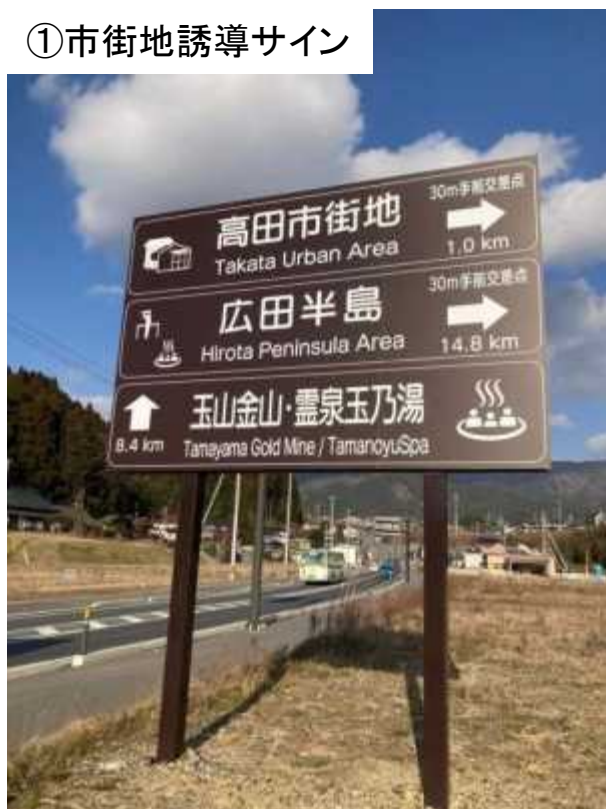
①市街地誘導サイン