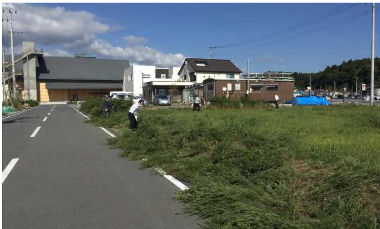
まちなか会会員によるコスモス畑の除草作業の様子

土地の適切に管理いただくため、継続して区画整理ニュースで地権者に呼びかけ。 また、まちなか会が中心市街地の未利用土地2筆・約2,000㎡について、地権者の了解を得てコスモスの種子散布。暫定的な花畑利用を実験中。