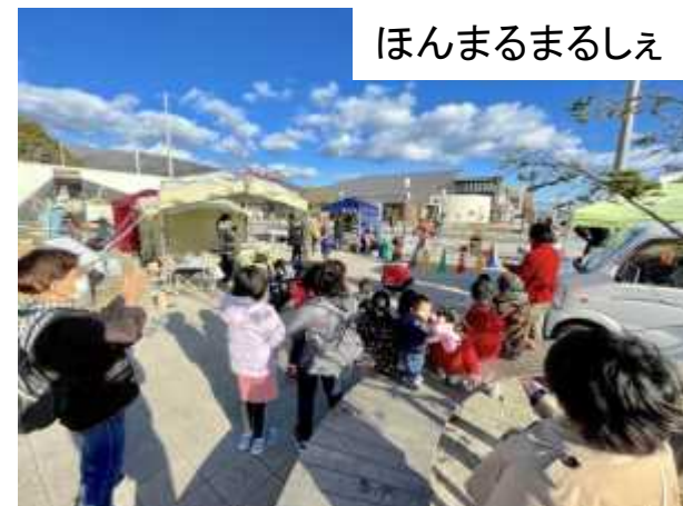
ほんまるまるしえ