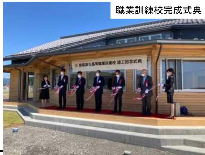
職業訓練校完成式典