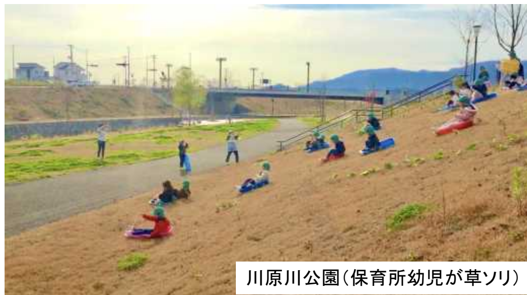
川原川公園(保育所幼児が草ソリ)