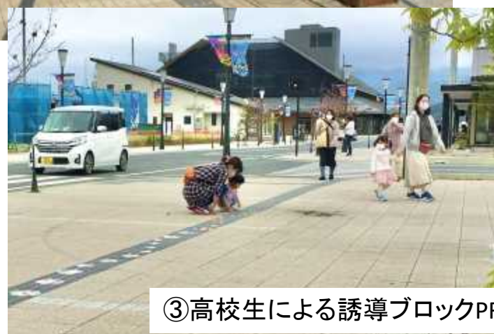
③高校生による誘導ブロックPR