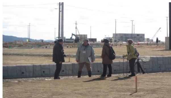
（高田地区 かさ上げ東④宅地引渡しの様子）

今後も、随時宅地の引渡しを進めてまいりますので、引き続き本事業へのご理解・ご協力よろしくお願い致します。