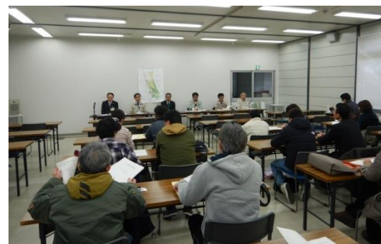
（今泉地区 高台3宅地引渡しの様子）