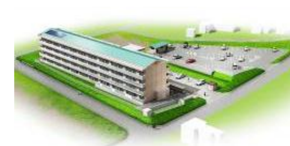
西下団地 イメージ図