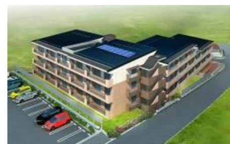
水上団地 イメージ図

※ 応募者多数の場合は、抽選とします。 ※ ④については、募集期間内に入居者が決定しない場合、継続募集とします。