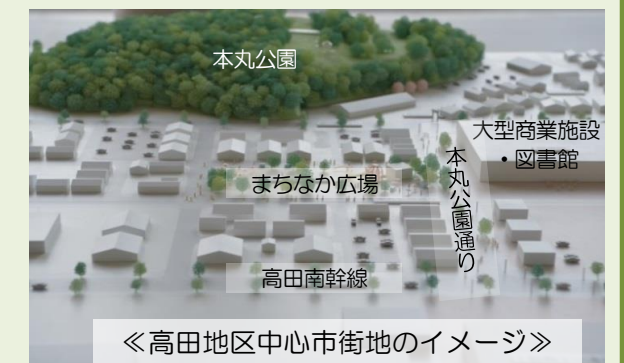
＜高田地区中心市街地のイメージ＞