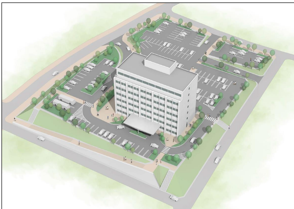
新庁舎完成イメージ図