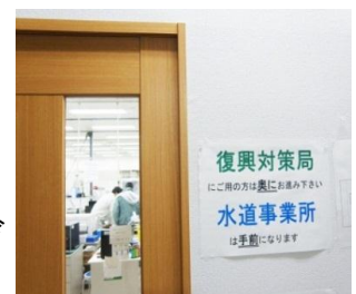
復興対策局は4号棟の1階に移動しました