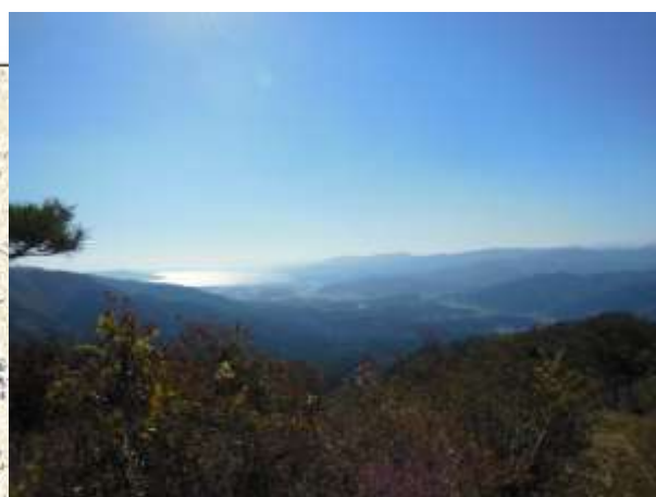
氷上山中腹（竹駒町）