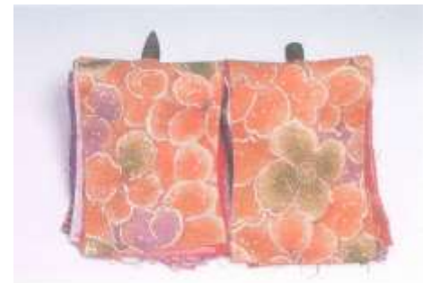
小田家のおしらがみ（矢作町）