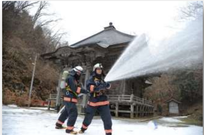
平成26年度 放水風景

開催場所は市指定文化財の 閑董院宥健尊師堂（矢作町）で の消防署、地域住民のご協力で 無事終了しました。