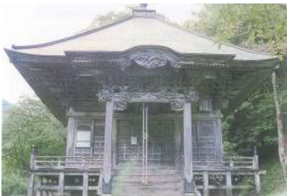
閑董院宥健尊師堂（矢作町）