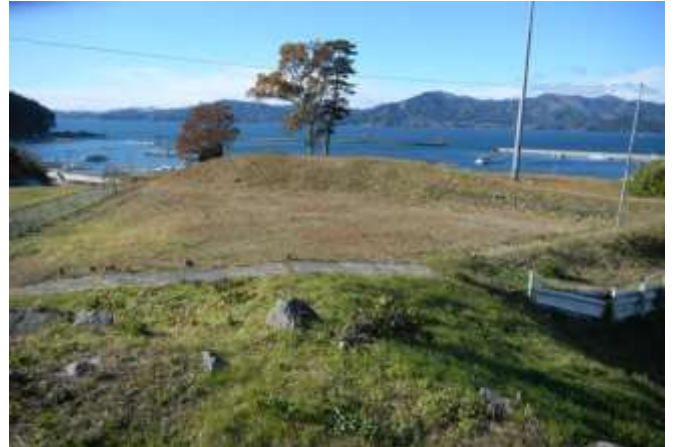
国史跡中沢浜貝塚からの眺望（広田町）