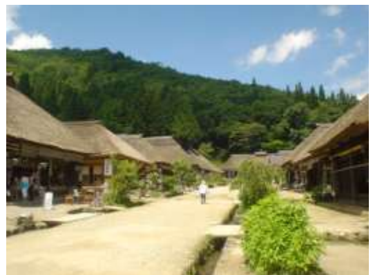
大内宿（福島県南会津郡）