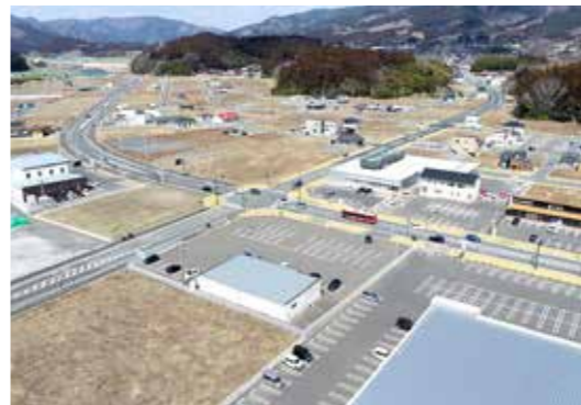
利活用の推進が求められる土地

答 将来にわたって、市民が 安心して暮らしていくこ とができ、さらには、経済的に も自立して発展していくことが できるまちとなることであると 考えている。