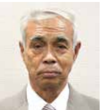
ふじくら たいじ 藤倉 泰治 (日本共産党)