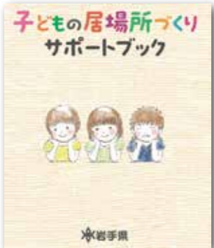
子どもの居場所づくり サポートブック (岩手県)

答 部活動や習い事、お祭り など多様な場が子どもの 居場所になりうると考えてい る。今後、アンケート調査等で