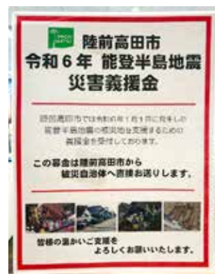
義援金の呼びかけ(市役所内)