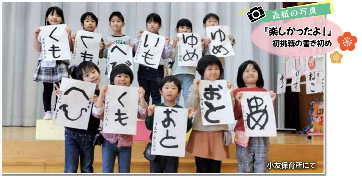
表紙の写真 「楽しかったよ!」 初挑戦の書き初め 小友保育所にて

議会だより第130号クイズの答え 7月に3回開かれたテーマ別議会と語る会の参加者の平均年齢は○才でした。 答え 51.6 才