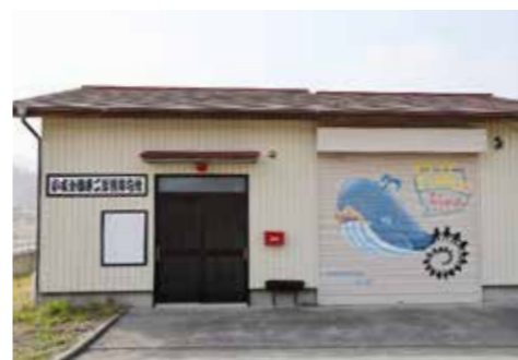
エアコンが設置される既存消防屯所

問 全屯所にエアコンを設置するの。 答 全屯所33カ所中、未設置11カ所へエアコンを設置する。