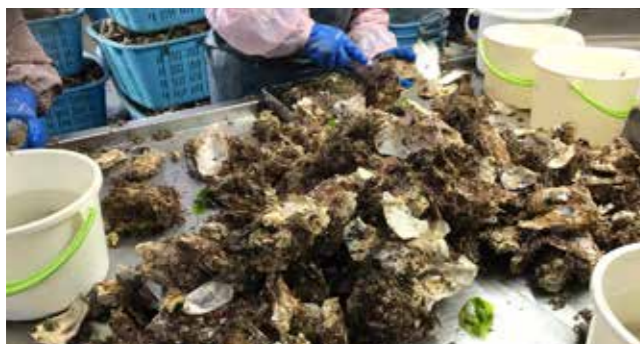
貝毒検査が義務付けられているカキ

問 書かない窓口システムとはどのような事業か。 答 窓口でマイナンバーカードや運転免許証を読み取ることで、氏名や住所などの情報が自動入力され、各種申請書への記入が不要となる。また、自宅などからスマートフォンを使って事前に申請書を作成できるようにする。なお、従来の手書きによる申請書についても引き続き設置する。