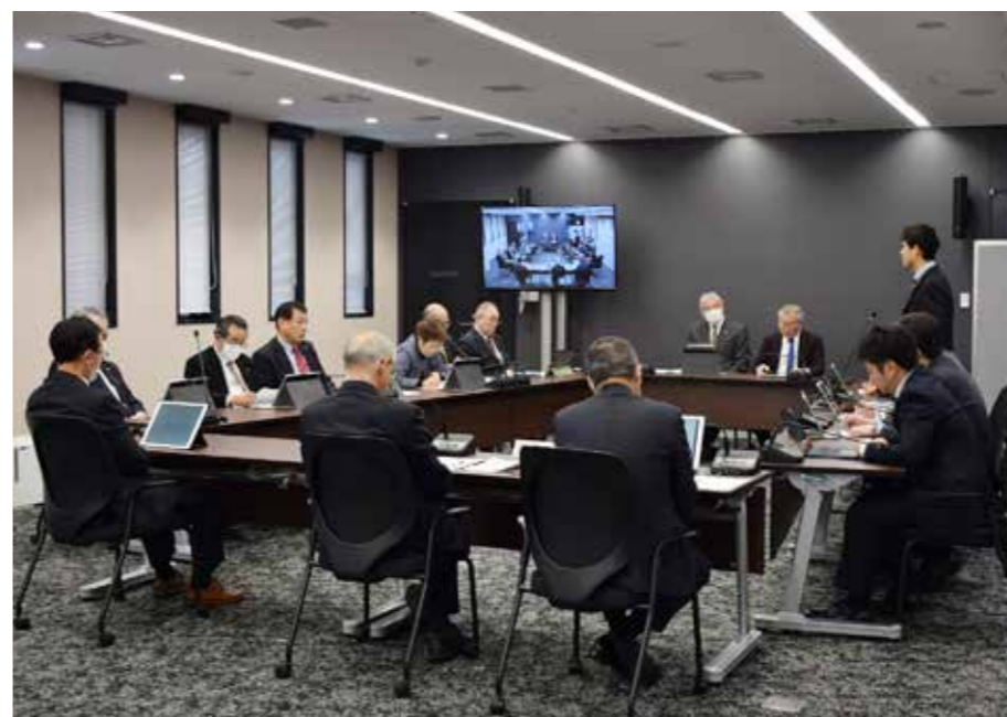
議員間討議の様子

問 財政調整基金の繰入金が12億円という大きな額となっている要因は。 答 各事業の内容を精査し