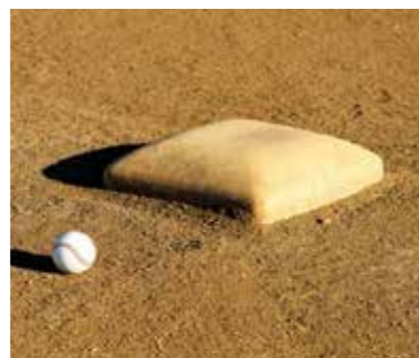
市公認のクラブチームへ