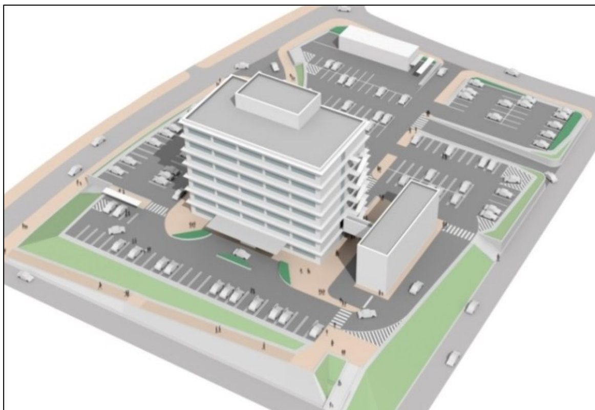
新庁舎完成イメージ図