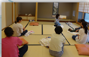
↑ 前期乳幼児学級の様子