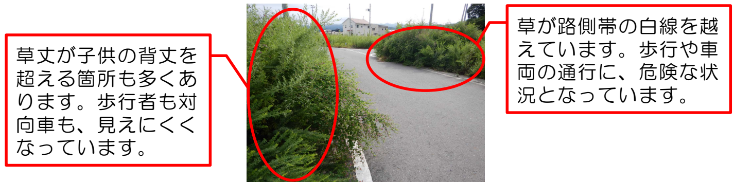
雑草が繁茂している宅地の様子(R4.8.26撮影)